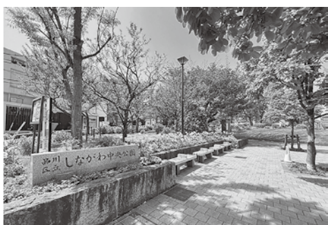
しながわ中央公園