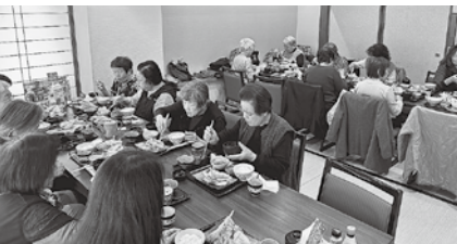
楽しくランチ交流会

令和6年4月21日にリニューアルオープンして、とても素晴らしい綺麗です。 資料と模型、映像を融合した常設展示室では、原始・古代・中世・近世・近現代の4つの時代区分で品川の歴史を紹介しています。 縄文時代の集落やお台場築造の模型等、ジオラマや復元模型が豊富で品川の歴史を学ぶ事ができました。