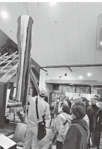
福島市民家園にて