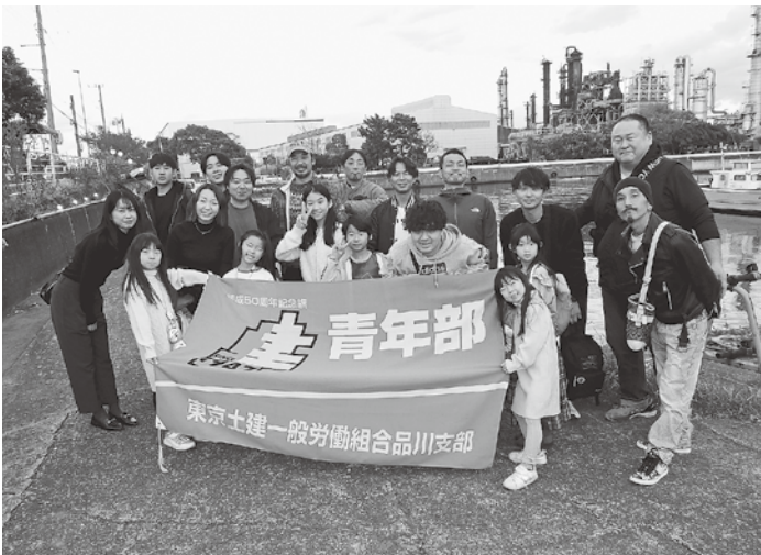
新たなルートでいざ出発!