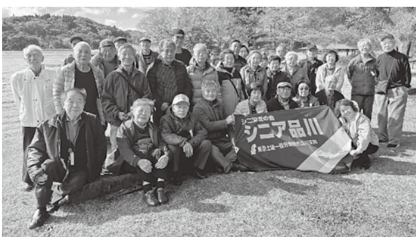
雨も止み、みんなで記念撮影