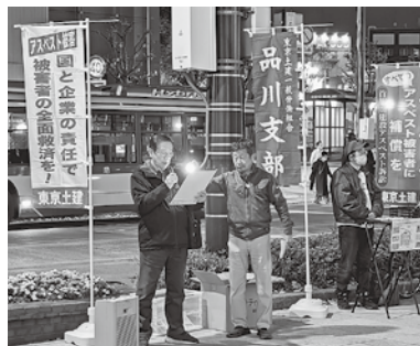
大井町駅阪急前にて

アスベストが建材に多く使用され、アスベストが舞う現場で働いてきた結果、肺がん等の病気を発症し、苦しめられていまふ。被害の責任が国と建材メーカーにあるとして、法廷闘争となり、国が責任を認め、アスベスト給付金制度が作られ、建材メーカーの間で和解の成立を勝ち取る等、歴史的な成果となっておりますが、今改めて世論を作るために、今後も取り組んでいきたいと思ひます。 当日、宣伝行動にご参加頂いた皆様、お疲れ様でした。