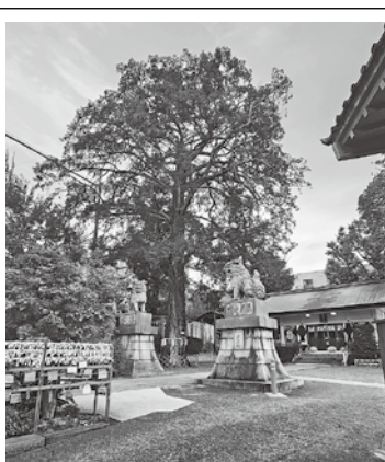
天祖神社 (下神明天祖神社)

車中では、ビンゴゲー ム・クイズ、夜は宴会で のカラオケで盛り上がり、 書記さんの細やかな企画 に感謝します。