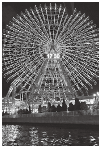
「みなとみらい」の夜景

川崎からみなとみらい のルートで、川崎の工場 夜景とみなとみらいの夜 景を眺めながら、青年部 の仲間達・青年部OBの 方々、家族や子ども達と たくさん交流を深めまし