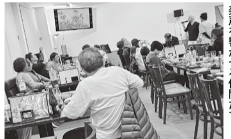
美声を響かせる仲間たち

沢山の御馳走と楽しい雰囲気の中、大人達がほろ酔い気分になった頃、カラオケ大会の始まりです。