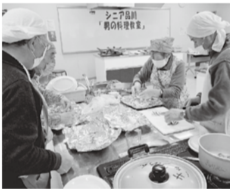
応援女性の手を借りながら

まだまだ寒さの続く1月26日(日)にシニア品川の年間行事の一つ「第15回男の料理教室」に参加しました。