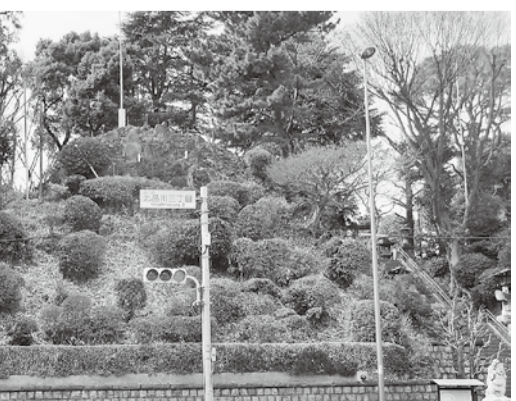
信号機の後方に見えるのが「品川富士」