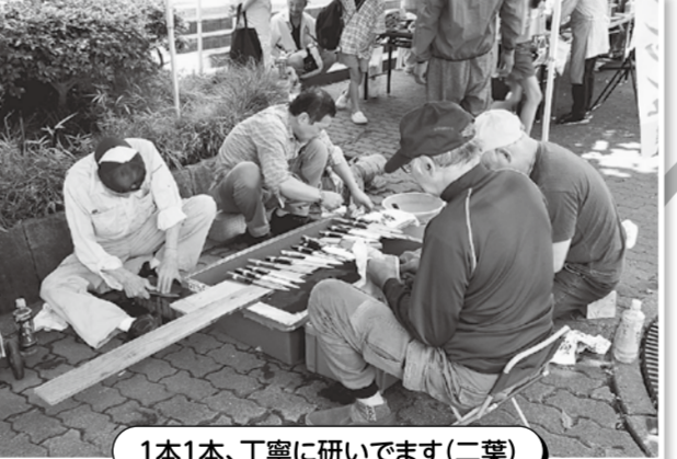
1本1本、丁寧に研いでます(二葉)

6月11日(日)、夜中から降り始めた雨が心配されましたが、午前9時過ぎには上がって、分会住宅デーが無事に開催されました。雨上がりのせい、お客さんの出足は、ポチポチ。それでも、ここ数年販売している『三陸ワカメ』110袋は、一時間足らずで完売となりました。住宅相談がなかったのが残念でしたが、88本の包丁がピカピカになって、返却されました。お手伝い頂いた皆様、お疲れ様でした。