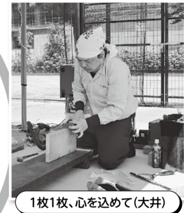
1枚1枚、心を込めて(大井)

コロナ禍も一段落し、4年振りの「分会住宅デー」が、リニューアルされた浜川公園で開催されました。開始早々に、「包丁研ぎ」・「ヨーヨーすくい」が人気となり、子供の笑顔が印象的でした。自分は、今年より「まな板削り」を担当していますが、住宅デーには、数年前の「青年技能大会」の表彰を受けた縁で参加するようになりました。現在、週1回ほど建築カレッジの講師を務めています、建築業界の「横のつながり」の重要性を実感しています。