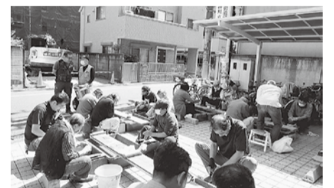
包丁研ぎ講習会の様子 (5月21日)

いくつかの分会で初参加者が見られ、また、初企画となる『包丁入れ袋』も、各分会で好評のようでした。