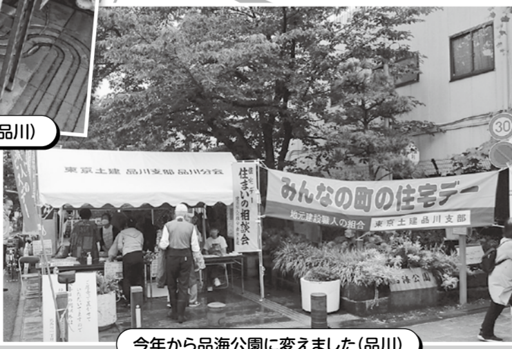
今年から品海公園に変えました(品川)