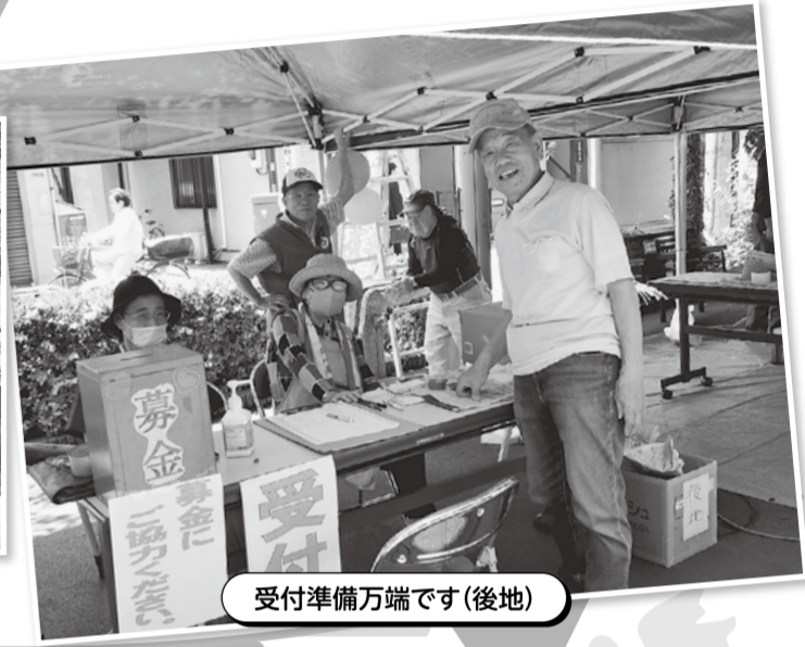
受付準備万端です(後地)