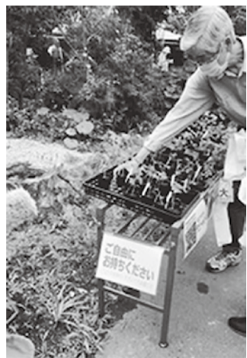
園内で薬草を配布することも