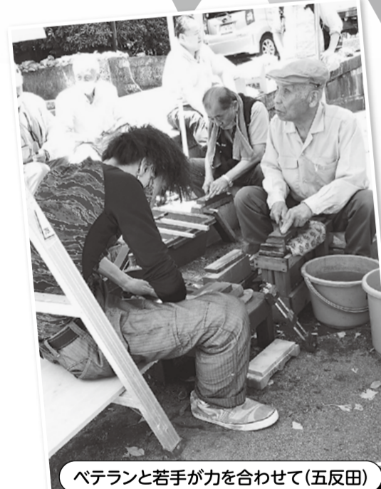
ベテランと若手が力を合わせて(五反田)