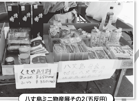
八丈島ミニ物産展その2(五反田)