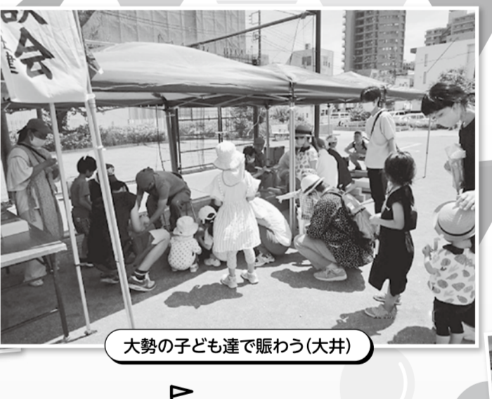
大勢の子ども達で賑わう(大井)