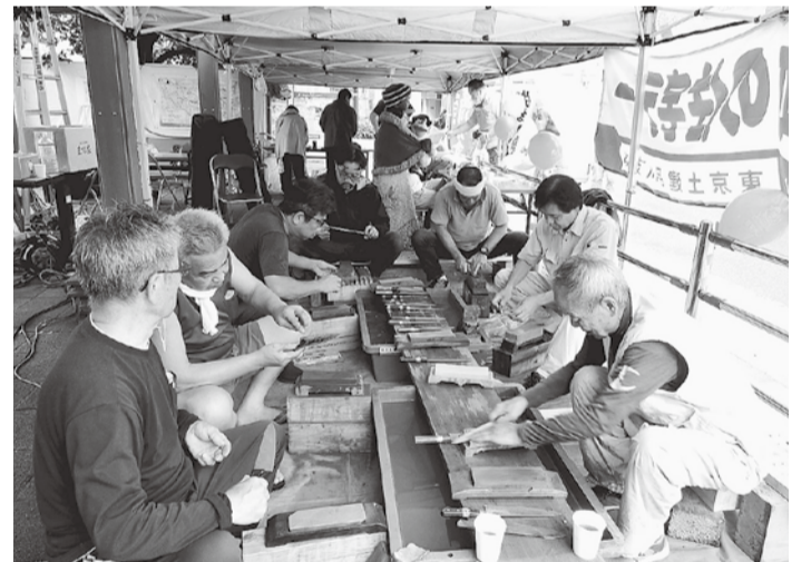
包丁を研ぎながら情報交換 (西品川)