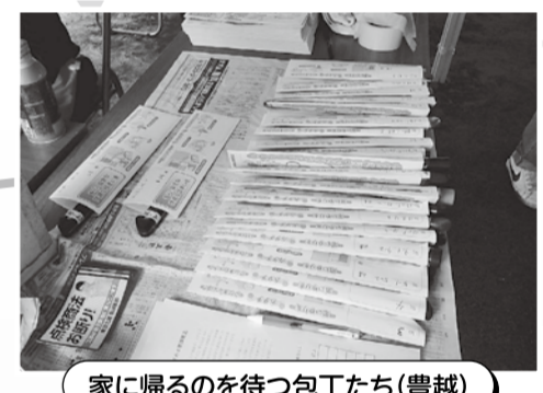
家に帰るのを待つ包丁たち(豊越)