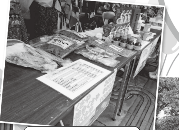
八丈島ミニ物産展その1(品川)