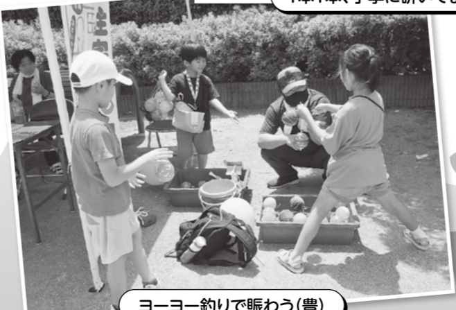
ヨーヨー釣りで賑わう(豊)