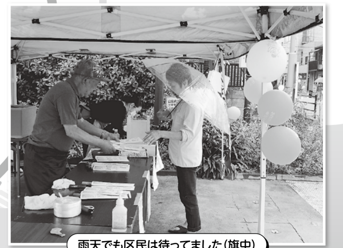
雨天でも区民は待ってました(旗中)