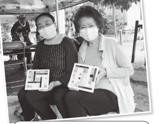
タイルモザイク、上手に出来ました(豊越)