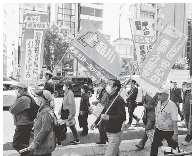
4年ぶりに青山をデモ行進

5月1日(月)に代々木公園で開催された、第94回中央メーデーは、4年ぶりの通常開催となり1万5000人が集う集会となった。新型コロナウイルスの影響で、2年中断、昨年は小規模開催だったため、久しぶりに人が多く集まった感じがあった。