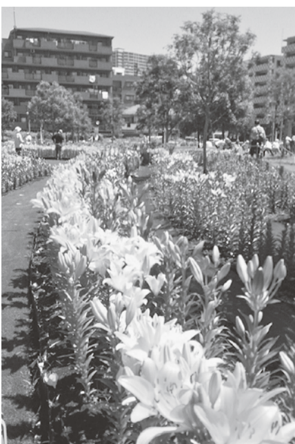
カラーでお見せできず残念!