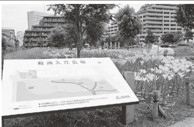
10000本のユリが咲き誇る 鮫洲入江広場公園

この後運河沿いに、コスモスの種まきを24町会で行ないますが、私は一年を通して『ぶらり、ぶらり』です。