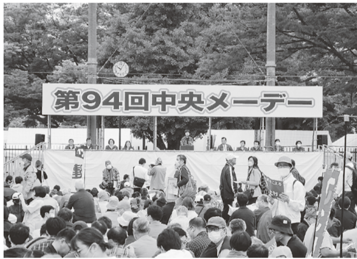
代々木公園に15,000人が参加

5月1日(月)に代々木公園で開催された、第94回中央メーデーは、4年ぶりの通常開催となり1万5000人が集う集会となった。新型コロナウイルスの影響で、2年中断、昨年は小規模開催だったため、久しぶりに人が多く集まった感じがあった。