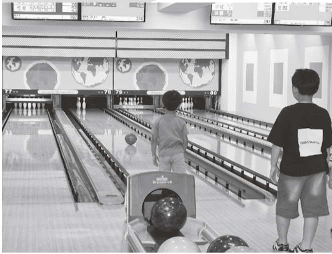
スベア取れたかな?

今回初めてボウリング大会に参加しました。コロナ禍明けの開催ということで、皆さんとの距離も縮まり、今まで以上に交流を深められたように感じました。