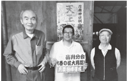
最終盤で月間目標を達成した品川分会

その結果、品川分会が月間目標を達成する奮闘をみせたものの、支部全体で37名にとどまり、本部目標である73名に到達できませんでした。6月当初人員を2026名として、2000名支部を堅持することが出来ましたが、改めましてこの拡大月間を振り返りますと、先ほども述べましたように、コロナ禍での状況の変化から、ある分会では