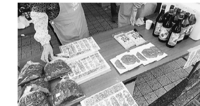
大好評! 八丈島物産&三陸ワカメ

地域住民の要望である、包丁研ぎコーナーは人気で、かなりの本数が集まりましたが、返却時にこれといったトラブルもなく、無事に終了、住宅相談も5件ほど寄せられました。