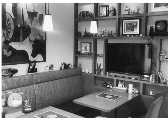
落ち着く空間が広がる店内

ふと目に入ったのは2人掛けのテラス席、店内を覗くと席数は少なめだが、落ち着いた空間が広がっていた。店内でマスターに因んだ『アルバトロス』