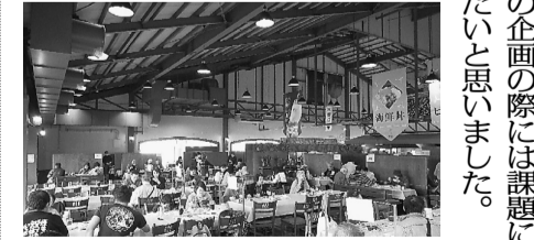
時之栖でゆったりランチ

▼昭和三大馬鹿 査定という国策がありました◆それは、戦前の大和・武蔵等の巨艦建造と伊勢灣干拓事業、そして青函トンネルと言われています◆評価はそれぞれ分かれませんが、一九八七年に整備新幹線計画が上がった時、当時の大蔵省の一主計官がその採算性を批判する為に比喩したものと云われています◆翻って長期政権が続いている今、国鉄民営化、専売公社民営化、郵政民営化等の国民の財産の不透明な放棄◆第二東名、本四連絡高速道路群と東京湾岸道路また成田空港、関西国際空港新設◆新国立競技場等建て替えを契機とする五輪問題。辺野古への米軍基地移設。新型コロナ関連でのアベノマスク。全国民への特別定額一律給付金◆そしてマイナンバーカードの必死の売り込み◆リア中央新幹線はどうでしょうか。羽田空港の都心部着陸飛行も、なし崩しの国策ですか◆諸々を決める議員の相続税の免除とか、歳費の見直しと世襲議員の跋扈(ばつこ)は相変わらず◆