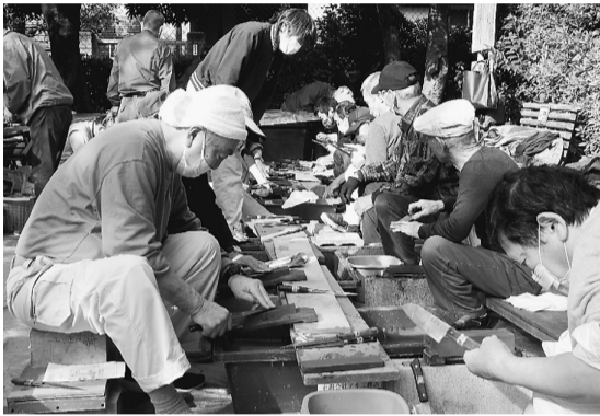
真剣な眼差しで包丁を研ぐ

鉢植えの花のプレゼント渡しを主婦の方々に担当して頂きました。今年もコーナーが増え、会場も賑やかな雰囲気となり、さらにうれしい事に、スタッフとして若い初参加の方が数名見受けられました。