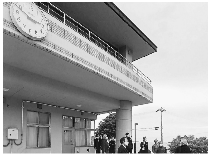
大地震発生後に止まったままの時計の前で話を聞く

語りの方のお話しては、この南三陸の海は大津波の後、海底が一扫されて50歳若くなり、海産