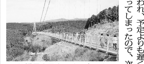
つり橋長さ日本一! 三島スカイウォーク

の駅や、わさびパークまで足を運んだ組合員・家族の皆さんも多く見られました。みかん狩りは、食べ放題と用意されたネットに詰め放題で、お土産として持ち帰ることができましたが、みかんが以外に甘く驚きました。