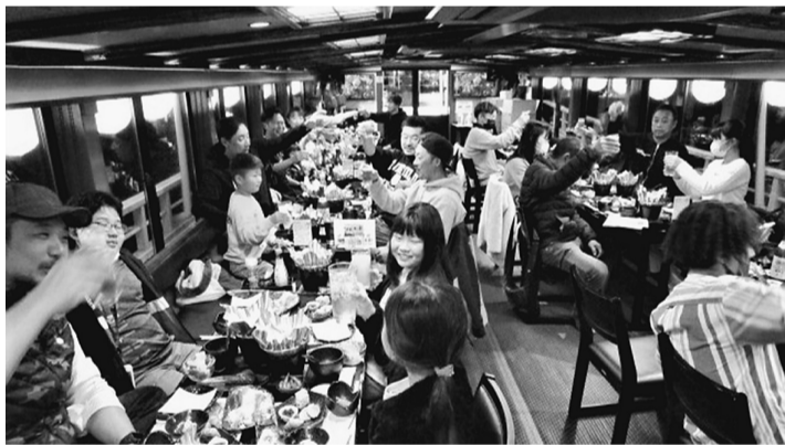
まずはみんなでカンパイ！