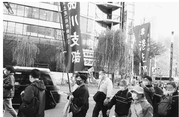
3年振りに銀座の街を練り歩く

お茶を渡して散会となりました。元気に楽しく充実した住宅デーとなりました。当日参加された組合員・主婦の方、書記の方、就労確保・諸要求実現・建設国保組合への現行水準予算確保の要望書を持って、財務局や福祉保健局等各局と各政党へと拍手に送られ庁舎に入りました。