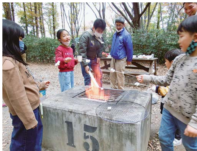
初めてのマシュマロ焼き

11月21日(日)、恒例のバーベキュー大会を、コロナ緊急事態宣言による数度の延期を乗り越え、34名の組合員・家族が集い、2年振りに品川区民公園で開催しました。