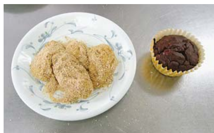
④バナナマフィン・きな粉みるくもち